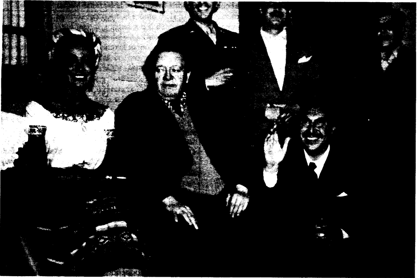
En primer plano, Columba Domínguez, Diego Rivera y Emilio Fernández.

nó, que la película de éxito es la que sabe expresar y dar cauce a los anhelos de la sociedad de su época.