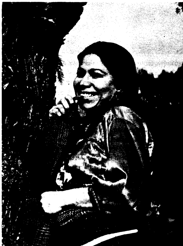
La India María